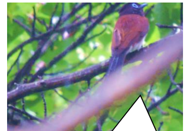
サンコウチョウ (田原市)