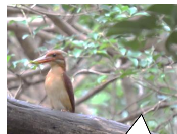
アカショウビン (渥美半島)