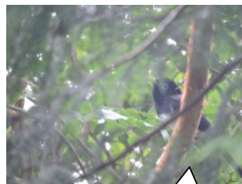
サンコウチョウ (田原市)

気温の上昇で散歩も出来ない状況が続き、室内でかき氷やアイスクリームを召し上がっていただき夏の季節を感じていただきました。時に花火を窓越しに見たり25日の夏祭りは外へ案内し、楽しんでいただきました。