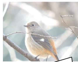
ジョウビタキ (大府市遊歩)

1月、2月はインフルエンザがすごくはやりましたねー。名古屋では学級閉鎖を乗り越えて、学年閉鎖も沢山発生したようです。インフルエンザワクチンは、当年南半で流行ったインフルエンザをもとにして作られるそうですが、今回はインフルエンザワクチンの製造に支障があり、はじめの頃はワクチン数が足りなくてなかなか接種できない人もいたようです。腸内フローラを整えて、免疫力を高めて、風邪に負けないようにしましょう。