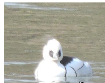
ミコアイサ。大府市遊歩道から撮影