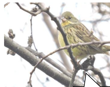
アオジ。大府市遊歩道