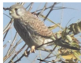
チョウゲンボウ。大府市遊歩道