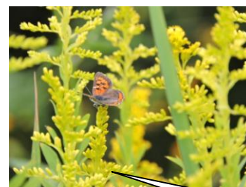
ベニシジミ。大府市遊歩道