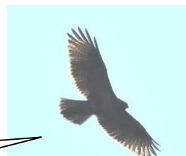
ノスリ (デイパーク上空)

平成30年4月オープン予定のグループホームも計画どおり、順調に建設の方が進み、外観はほぼ出来上がりました。近くに来たときは、ちょっとのぞいてみてください。みなさま、よろしくお願ひ致します。