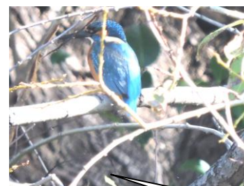
カワセミ。大府市遊歩道