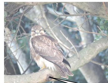
ノスリ。大府市遊歩道